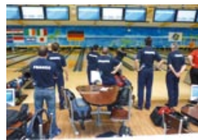
Entraînement avant la compétition sur les 56 pistes du Bowling de Munich.